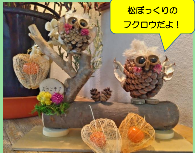
丸太一本から作ったフクロウの工作 武岡病院の玄関でお待ちしています♡