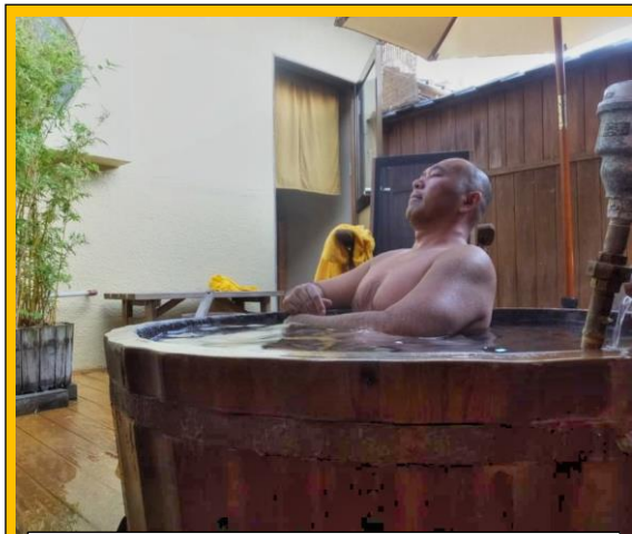
温泉が気持ちいい季節になりました